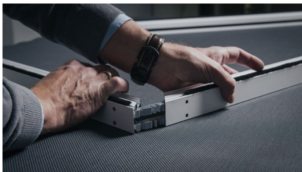
[heroal Ready VS Z EM_Montage_Schritt 2]

Bez papíru a s úsporou času: v aplikaci heroal Business Configurator mohou odborní partneři společnosti heroal vytvářet nabídky a zadávat objednávky digitálně.