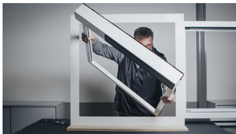
[Einfache Montage_heroal Ready VS Z EM]

Für eine besonders effiziente Fertigung und Montage hat heroal drei Produktneuheiten im Programm, deren einfache Fertigung in regelmäßig stattfindenden Live-Demonstrationen auf dem heroal Messestand auf der BAU 2023 vorgestellt wird.