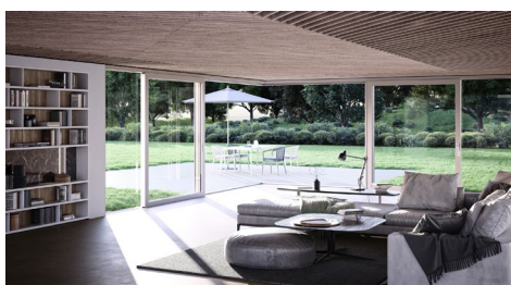
[Wohnwelten_heroal S 77 SL_Ecke zum Öffnen]

Mit innovativen Lösungen für Smart Home und Smart Building präsentiert sich heroal auf der BAU 2023. Mit der Lüftungsklappe heroal W 72 VF können kontrollierte, natürliche Lüftungskonzepte umgesetzt werden.