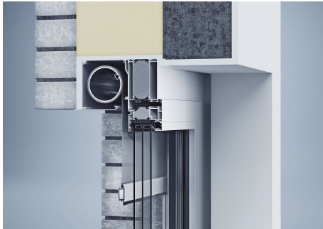
[heroal W 77 PH]

Wärmedämmung bei besonders geringer Bautiefe: Mit heroal Fenstersystemen lassen sich die Anforderungen des GEG 2020 sowie des Passivhaus-Instituts Dr. Feist erfüllen.